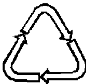
Рисунок 4 - возможность утилизации использованной упаковки (укупорочных средств) - петля Мебиуса