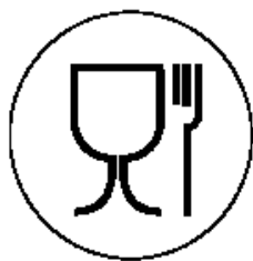
Рисунок 1 для пищевой продукции