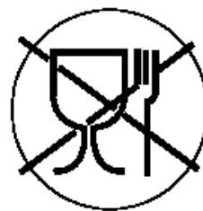
Рисунок 3 для непищевой продукции