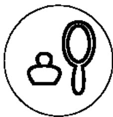
Рисунок 2 для парфюмерно- косметической продукции